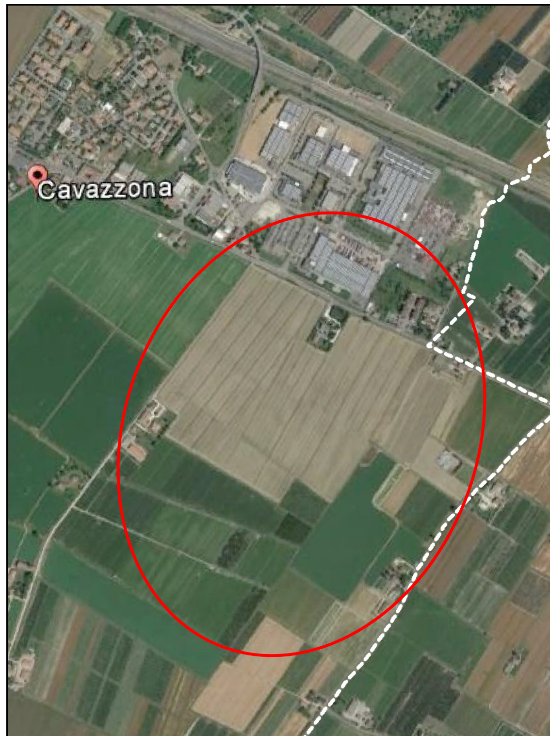
Inquadramento su immagine satellitare