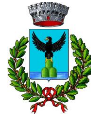
Comune di Montese