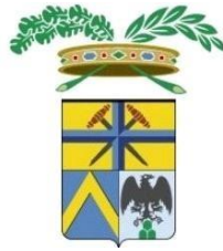
Provincia di Modena