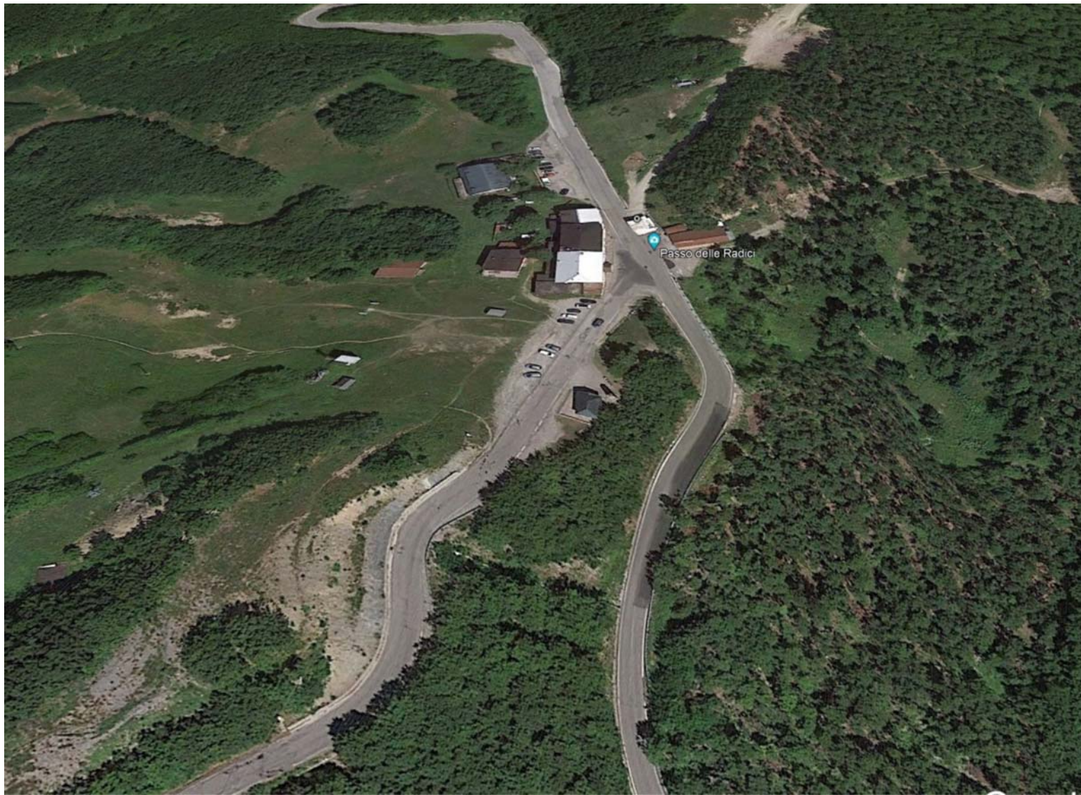
Inizio competenza (incrocio con SP 324)